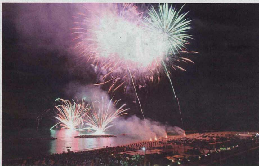
Lo spettacolo pirotecnico sul mare durante i festeggiamenti di S. Anna dello scorso anno.

Nell'estate di Potenza Picena e di Porto Potenza fioccano le iniziative, le feste, le serate a tema e le tante occasioni organizzate nei luoghi caratteristici del territorio, che consentono di vivere e apprezzare le belle vie e piazze del territorio e che richiamano un gran numero di persone anche dai comuni limitrofi. Quella attuale, per esempio, è la settimana dei festeggiamenti dedicati a S. Anna, Santo Patrono di Porto Potenza Picena. Numerose le iniziative organizzate ogni giorno dall'apposito comitato deputato ai festeggiamenti, tra cui i più attesi sono il concerto di Arisa di sabato prossimo 24 luglio in piazza Douhet e lo spettacolo pirotecnico che si terrà nella serata di domenica 25. Quest'ultimo è diventato, per spettacolarità e sontuosità, uno degli eventi pirotecnici più importanti dell'intero panorama regionale e che richiama ogni anno a Porto Potenza migliaia e migliaia di persone provenienti non solo da tutto il territorio comunale e da quelli limitrofi ma anche da fuori provincia. E poi ci sarà la tradizionale fiera di S. Anna per l'intera giornata di martedì 27 lungo le vie del paese, il concerto la