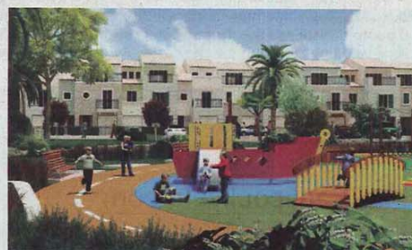
Il nuovo quartiere di Porto Potenza Picena (nell'ultima pagina di questo inserto speciale, maggiori dettagli del progetto)

Le prenotazioni di vendita saranno aperte alla fine dell'anno presso la ditta Eco Città Management S.r.l. Le vendite, i mutui e la realizzazione di tutto il progetto è svolta in collaborazione con Carifermo per dare risposte sia alle specifiche esigenze del mercato immobiliare, sia alle diverse capacità finanziarie di investimento.